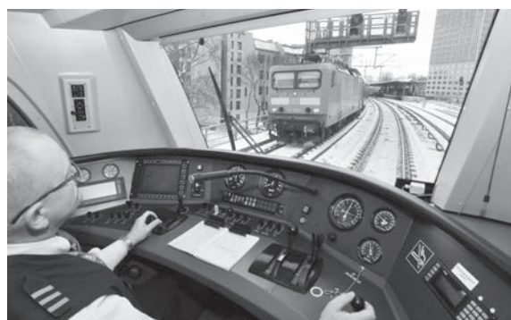
Подобренията също ще обхванат системите за сигнализация и управление