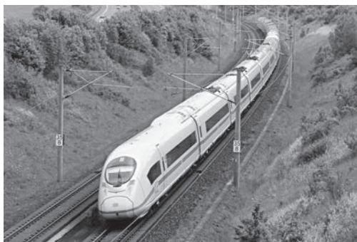
До 2020 г. ще бъдат обновени 17 000 км германски железни пътища