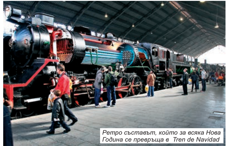
Ретро съставът, който за всяка Нова Година се превръща в Tren de Navidad