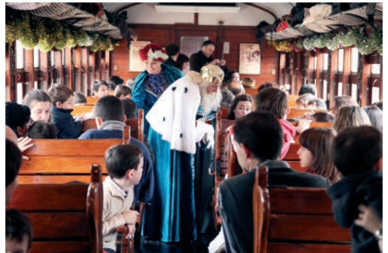
По време на пътуването персонажи от Библията и приказките зареждат с празнично настроение малки и големи