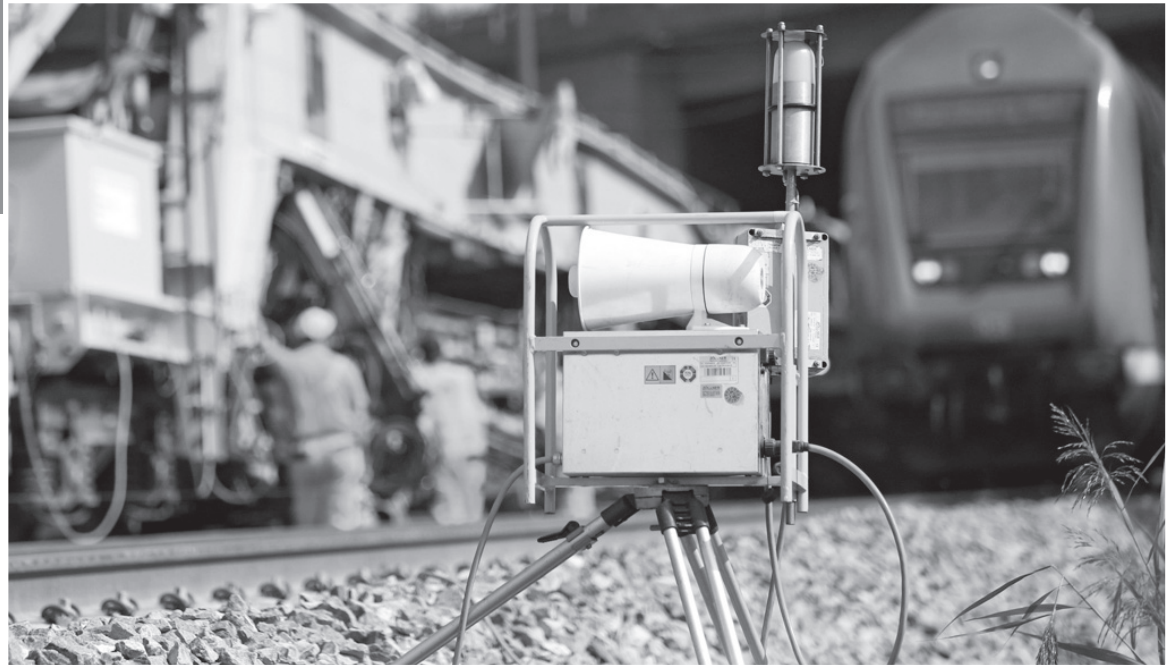
Германските железници започват изпълнението на най-голямата си програма за модернизация на инфраструктурата

Германските железници от години алармират, че голяма част от железопътната мрежа в страната се нуждае от сериозна рехабилитация. В това число попадат редица жп участъци, строени още в края на XIX век, които трябва да бъдат приведени в съответствие със съвременните стандарти. Около 1300 железопътни мостове от общо около 25 000 пък се нуждаят от спешен ремонт. По думите на изпълнителния директор на Deutsche Bahn Рюдигер Грюбе, с изключение на трасетата на съвременните високоскоростни експреси, повечето останали линии (и особено регионалните) имат нужда от модернизация. За тази цел обаче собствените средства на монополиста не са достатъчни, което наложи и