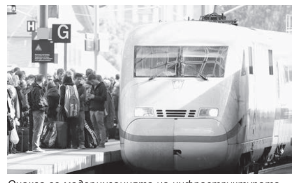
Очаква се модернизацията на инфраструктурата да намали закъсненията и повиши пунктуалността на немските влакове