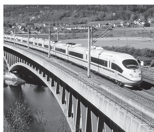
Ремонтите ще засегнат 857 железопътни моста и стотици тунели

За да се изпълни планът в рамките на инвестиционната програма, Deutsche Bahn трябва да привлече на щат допълнително около 1700 служители. „Това е най-голямата програма за модернизация в историята на Deutsche