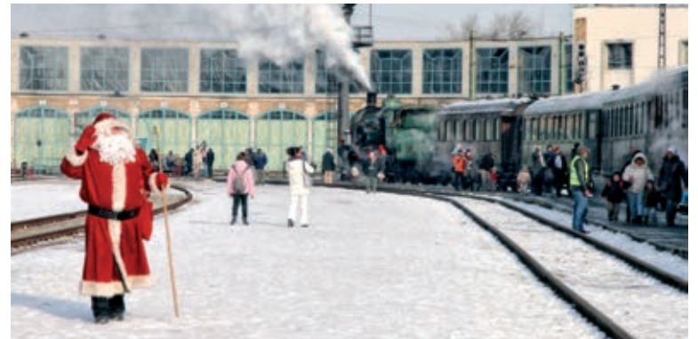
Предвидена е и среща с дядо Коледа