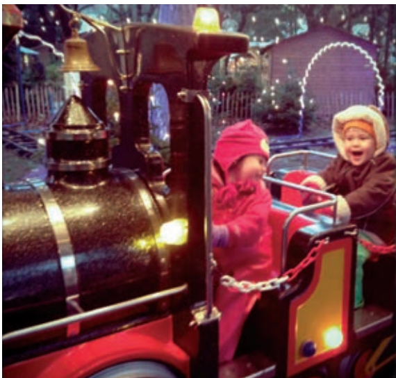
В двора на музея на железниците в Мадрид малчуганите ще бъдат приятно сюрпризираны от детски влакчета и коледни лакомства