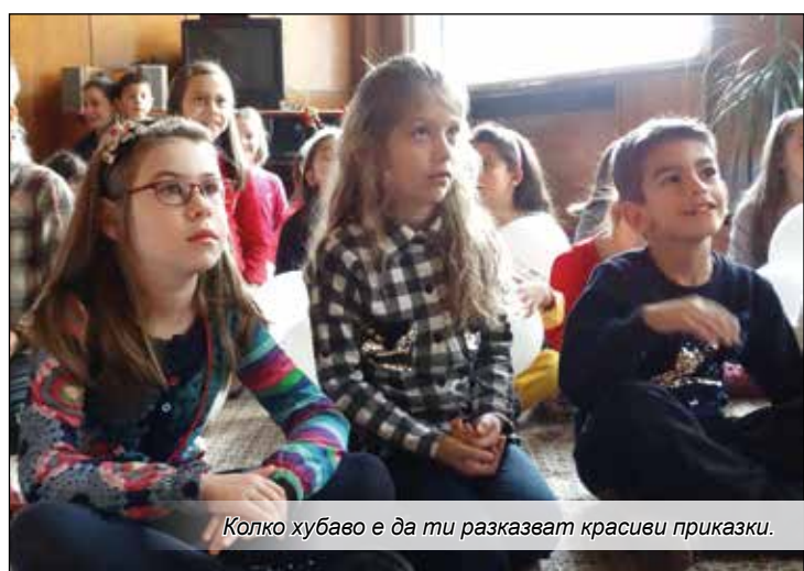
Колко хубаво е да ти разкажат красиви приказки.