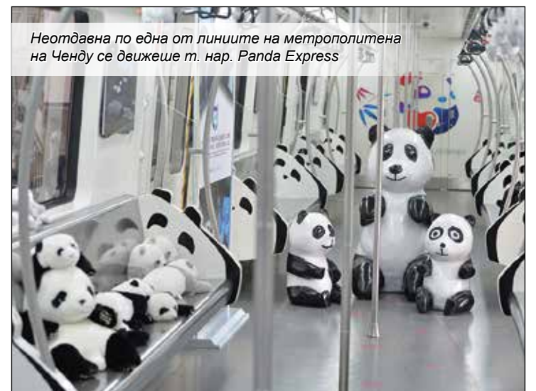
Неотдавна по една от линиите на метрополитена на Ченду се движеше т. нар. Panda Express