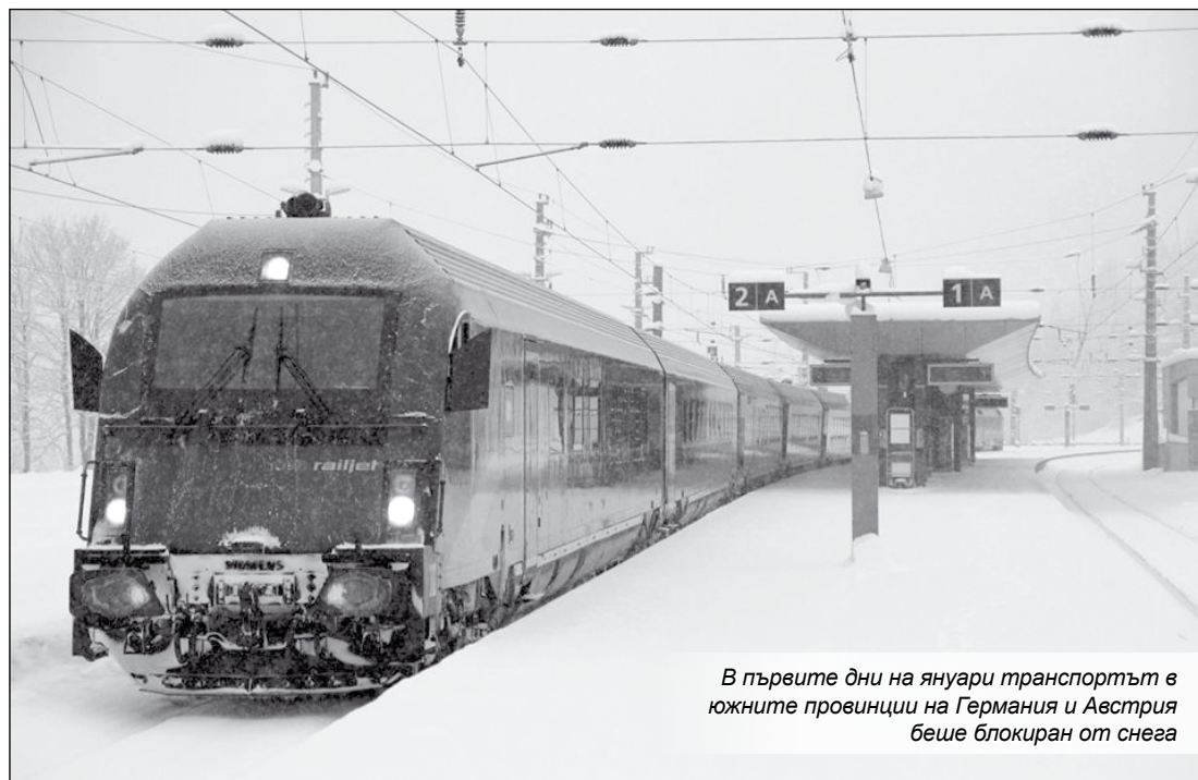
В първите дни на януари транспортът в южните провинции на Германия и Австрия беше блокиран от снега

Руската зима е всеизвестна със своята суровост и трудна предсказуемост. Ето защо там са се постарали да подсилят жп транспорта срещу предизвикателствата ѝ с множество дизелови и електрически локомотиви със снегоразривни устройства, роторни жп снегорини, релсови