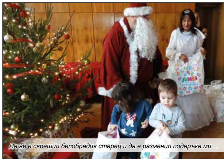
Да не е сарешил белобрадия старец и да е разменил подаръка ми...