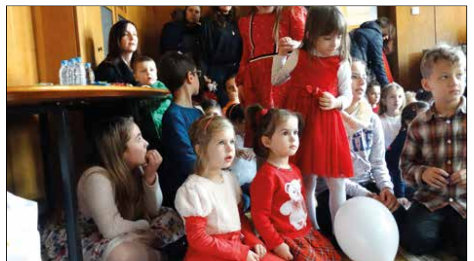
И малките принцеси и принцове заемат пред вълшебствата.