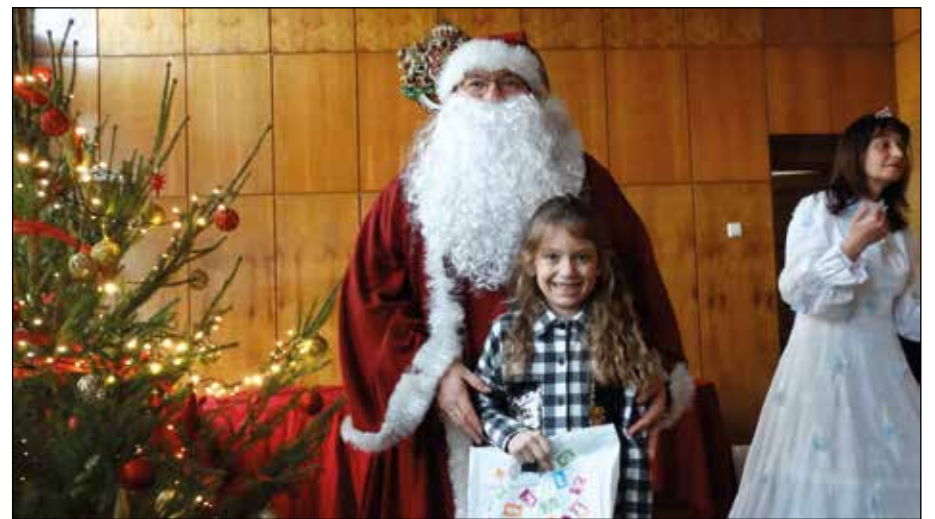
Съвсем друго е, когато вече си получил подаръка си.