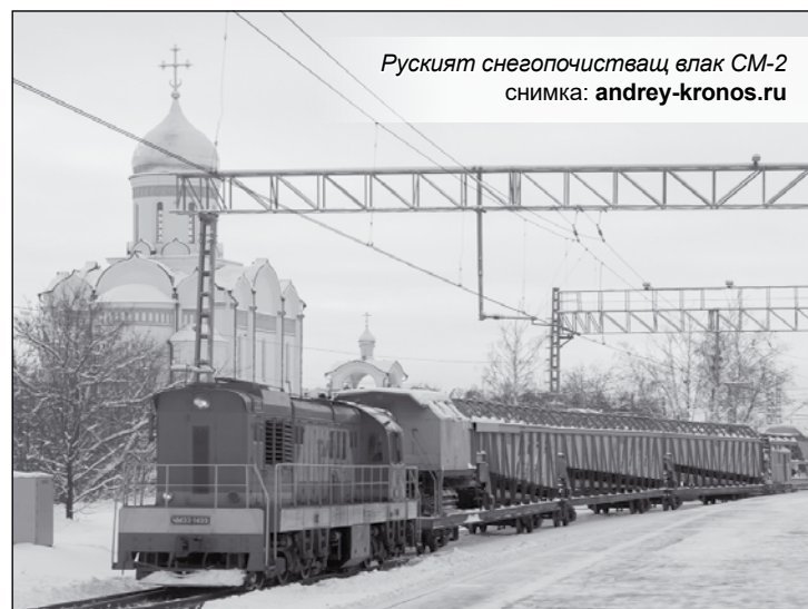
Руският снегочистващ влак SM-2