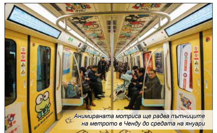
Анимирания мотриса ще радва пътниците на метрото в Ченду до средата на януари