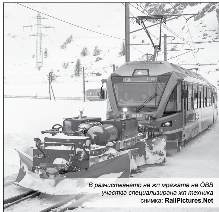
В разчистването на жп мрежата на ÖBB участва специализирана жп техника