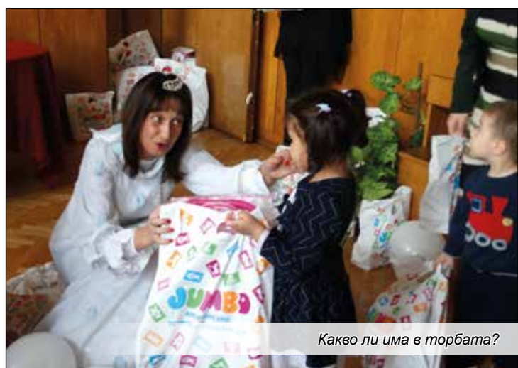
Какво ли има в торбата?