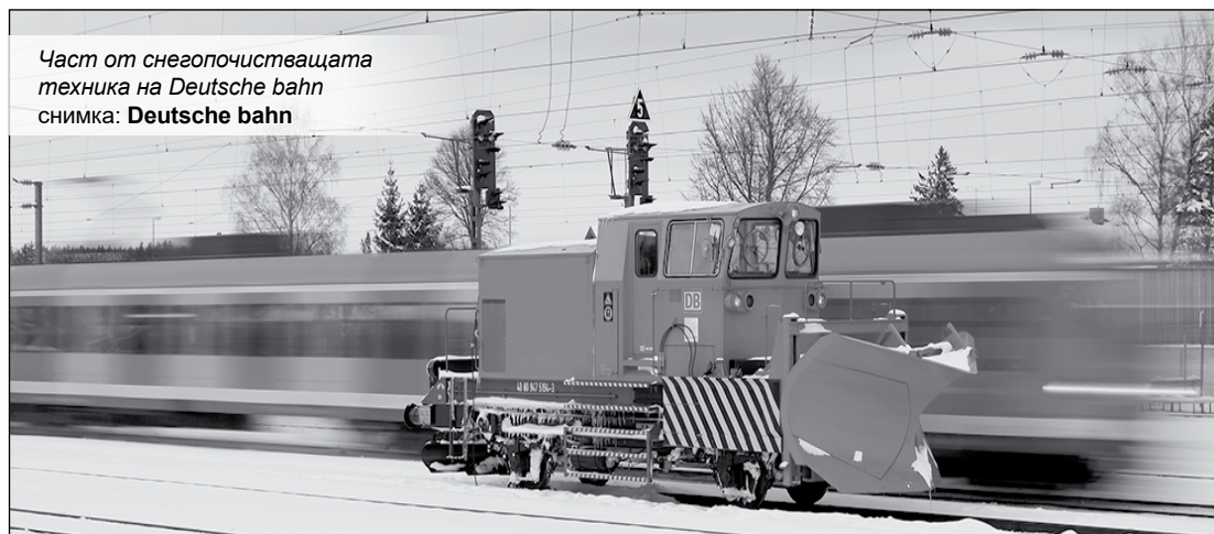
Част от снегочистващата техника на Deutsche Bahn