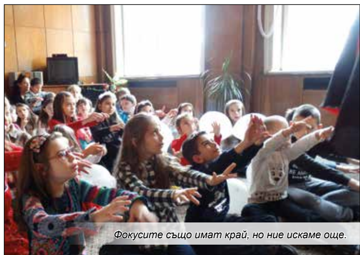
Фокусите също имат край, но ние искаме още.