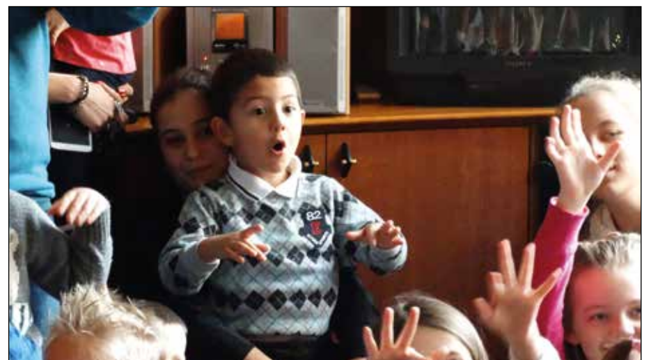
Колко много нови приятели!