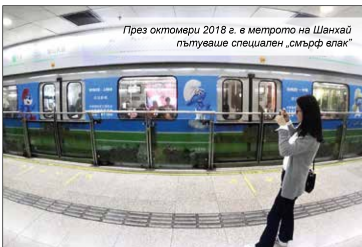
През октомври 2018 г. в метрото на Шанхай пътуваше специален „смърф влак“