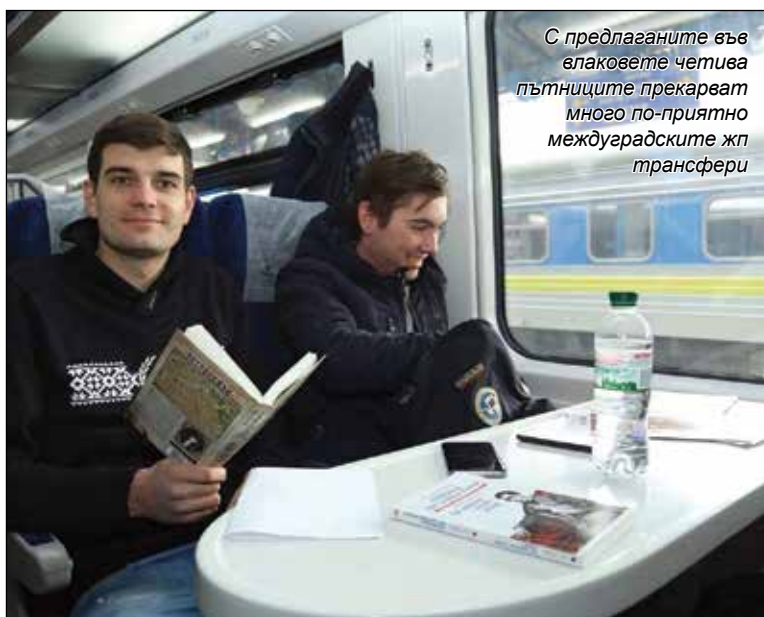
С предлаганите във влаковете четива пътниците прекарват много по-приятно междуградските жп трансфери