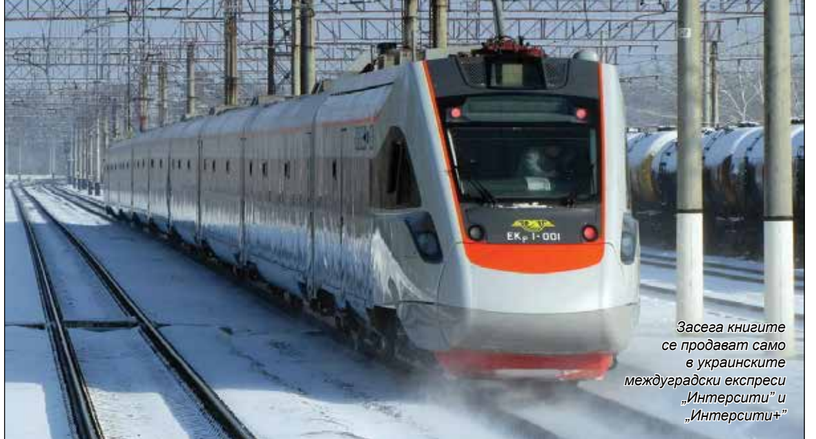
Засега книгите се продават само в украинските междуградски експреси „Интерсити“ и „Интерсити+“

Търговията с книги в украинските експреси се осъществява по каталог.