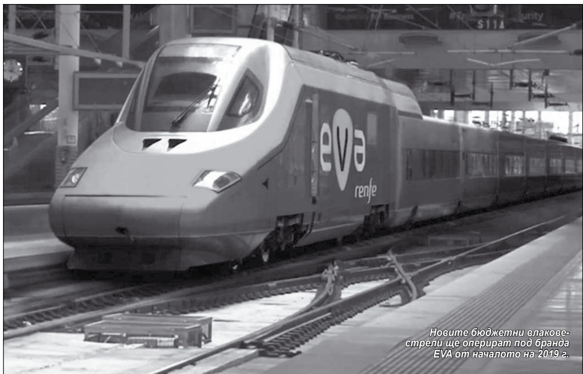
Новите бюджетни влакове-стрели ще оперират под бранда EVA от началото на 2019 г.

За осъществяване на бюджетните превози под бранда EVA е предвидено да бъдат привлечени три скоростни влака Talgo S102. Те ще изпълняват ежедневно по пет пътувания (в посока) между мадридската жп гара Аточа и новия транспортен жп терминал край международното летище на