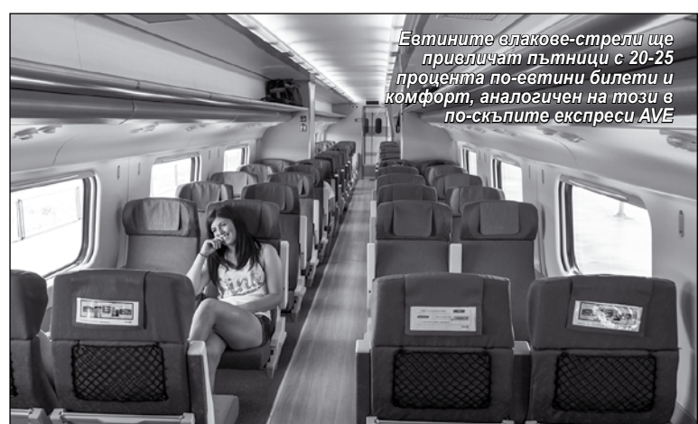
Евтините влакове-стрели ще привлекат пътници с 20-25 процента по-евтини билети и комфорт, аналогичен на този в по-скъпите експреси AVE

Намеренията на Air Nostrum (ILSA) да се конкурира с иберий-