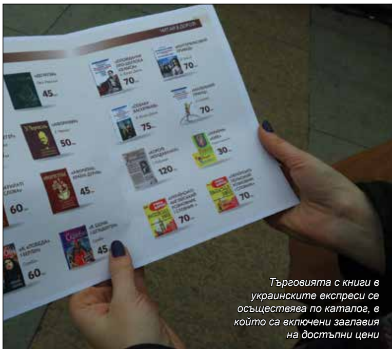
Търговията с книги в украинските експреси се осъществява по каталог, в който са включени заглавия на достъпни цени

* Букросинг (BookCrossing) е практика да се оставят книги на обществени места, за да бъдат намерени и прочетени. Всяка книга носи уникален номер, чрез който в Интернет може да се проследи нейното движение. Създател на инициативата е американският програмист Рон Хорнбейкър, а сайтът, в който се регистрират и следят заглавията, датира от 2001 г. Хората, които „хванат“ освободена книга, следват инструкциите, дадени на етикета: да посетят www.bookcrossing.com , за да видят къде е била книгата и да запишат отново, за да узнаят букросърите преди тях, че тя е в добри ръце. След като я прочетат, те от своя страна я „освобождават“ на обществено място, за да бъде отново намерена. Феноменът е разпространен в над 130 държави.