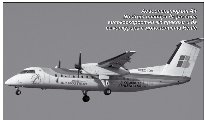
Авиооператорът Air Nostrum планира да развива високоскоростни жп превози и да се конкурира с монополиста Renfe