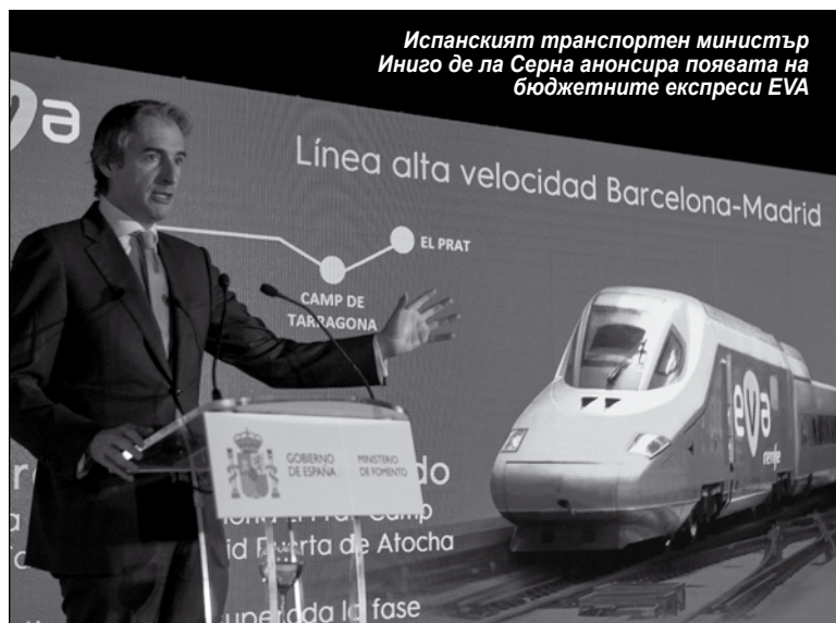
Испанският транспортен министър Иниго де ла Серна анонсира появата на бюджетните експреси EVA