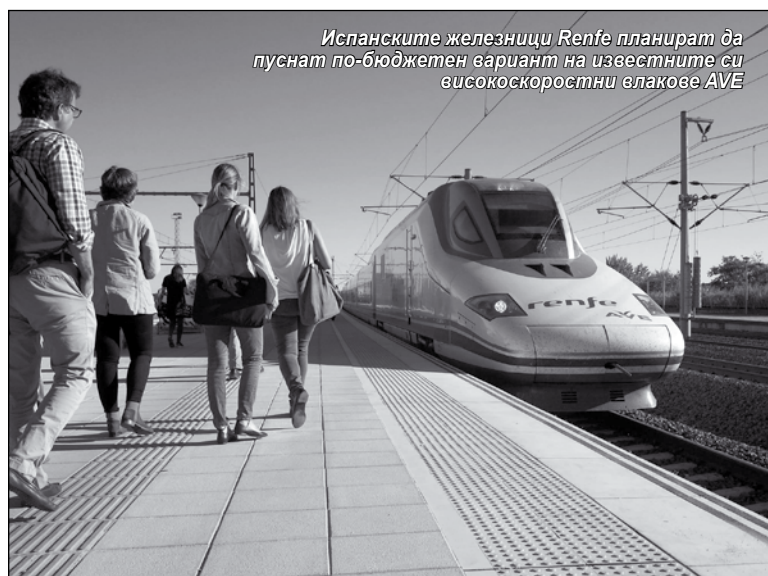
Испанските железници Renfe планират да пуснат по-бюджетен вариант на известните си високоскоростни влакове AVE

* Националната комисия по пазара и конкуренция (CNMC) на Испания е оръжието, което отговаря за запазването, гарантирането и насърчаването на правилното функциониране, прозрачността и наличието на ефективна конкуренция и ефективно регулиране на всички пазари и производствени сектори в полза на потребителите. – Бел. авт.